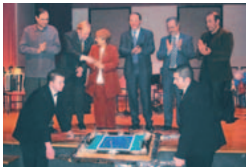
Les maires de CINETE.

Ces projets permettent aux acteurs locaux d'élaborer des échanges durables et de s'enrichir en permanence de leurs différences au profit des habitants des 7 villes.